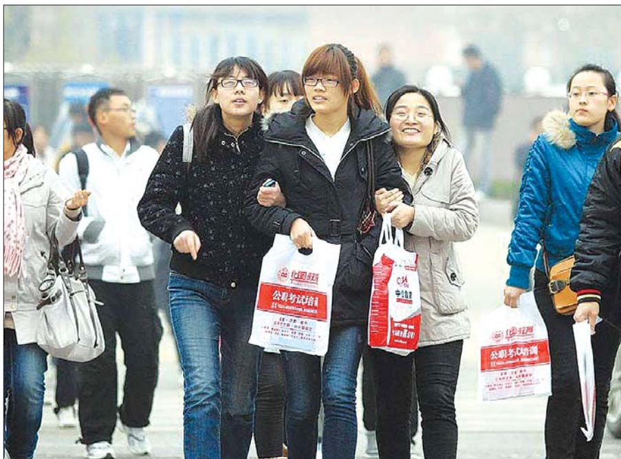
往年公务员考试都在四月份进行。(资料片)

五是申论考试时间进行了调整。申论考试时间调整为180分钟,较往年延长了30分钟。