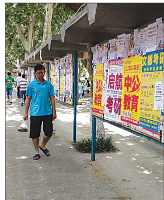
校园里随处可见省考的辅导班公告。

据了解,泰城各大高校的毕业生基本都在6、7月份开始离校,毕业季与省考撞车,一定程度上增加了考生备考难度,“我和同学准备在学校附近租一套房子,专心准备省考。”毕业生小王说。