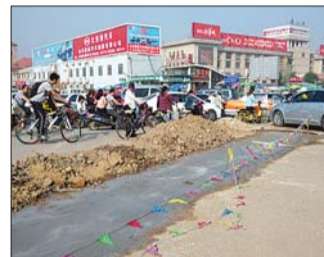
路面已经铺上水泥。

本报泰安5月22日讯(记者 张伟) 22日早上8点左右,记者经过龙潭路火车站附近时,路上显得比较拥堵,车辆缓慢前行,并出现压车现象。泰山火车站与财源大街路口,几堆土石挡在路上,另一侧拉有安全警示线,路面上铺有水泥,还有点潮湿。