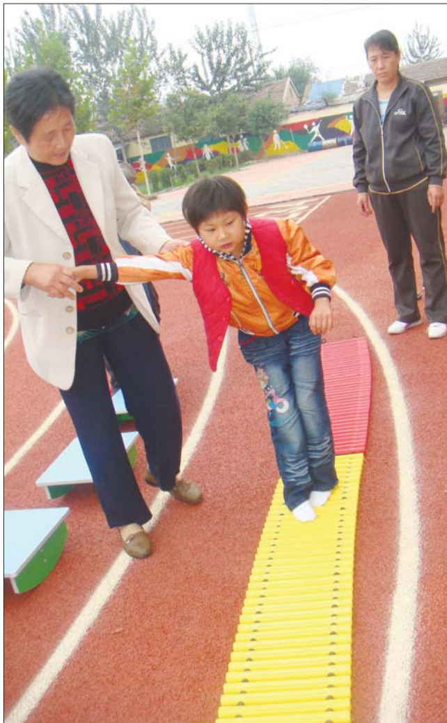
26日,德城区特殊教育中心的儿童正在老师引导下做康复训练。

“我们将根据学校的需求,为其捐赠体育用品、盲文读物以及特教用品等。”安利(中国)日用品有限公司德州分公司志愿者表示,除此之外,还将对特殊儿童进行心愿征集,并帮其完成心愿。