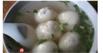
豆腐圆子 外用葛粉包裹，里有豆腐和肉末为馅料。