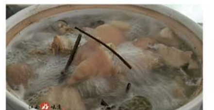
香藤猪蹄 香藤是一种中草药，对小孩子生长发育极有好处，还通经活络，益血补气。