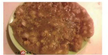
龙游肉圆 肉圆不是圆的，用番薯粉芋泥和猪肉制成。