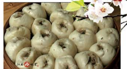
葱油馒头 家家户户过年都会做，和一般馒头不带馅料不同，馒头带有笋丝等馅料。