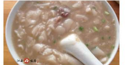
龙游米糊 作为龙游比较有代表性的小吃，一直是龙游人早餐的主打。