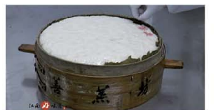
龙游发糕 乡音为福高，步步高，年年发，过年必备美食。