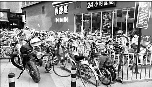
一超市附近自行车停放杂乱。

完备,无残疾人通道或厕位。还有部分商超无投诉窗口、投诉电话等。督查人员将问题指出后,商超负责人表示将立即整改。“大型商场超市、专业批发市场等商业零售行业有专门制