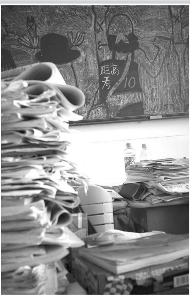
距离高考只有10天,有的书本已经陪伴了自己1000多天,书本显得有些陈旧和杂乱无章,但即使如此,还是觉得自己看不够。