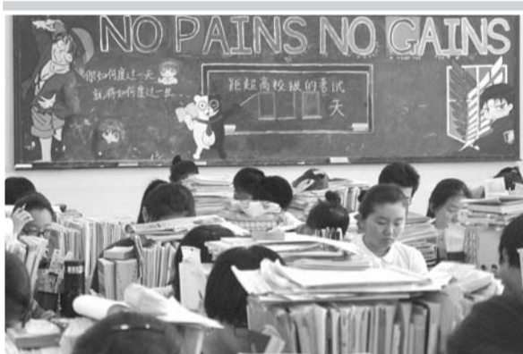
不劳无获。充满活力的色彩伴随的是他们为梦想奋斗的冲锋号。

28日上午11点多,“烹饪鼻祖伊尹画像”揭幕仪式暨“中国鲁菜研发基地”揭牌仪式在福山美食城举行。来自中烹协、省烹协、市烹协以及福山区有关领导及各界嘉宾共同见证了这一时刻。