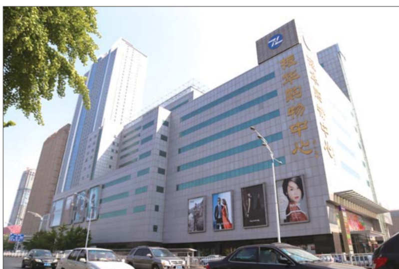
现在的振华量贩和振华购物中心。