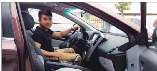
记者坐在宽敞的车内