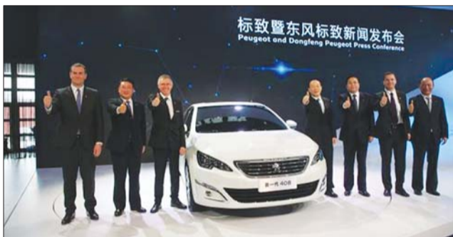
上市当天,东风标致408光彩夺目。

“T”就是指1.6 THP发动机,这是东风标致启动“E动战略”后推出的一款“高效、经济、环保”的发动机。“STT”,简单说就是发动机智能启停系统,是一种“微混”节能技术。当行车过程中制动停车时,发动机三秒后自动关闭;再次出发时,简单操作,发动机瞬间自动重启。“T”和“STT”的组合使用,给新一代408带来更强劲的动力