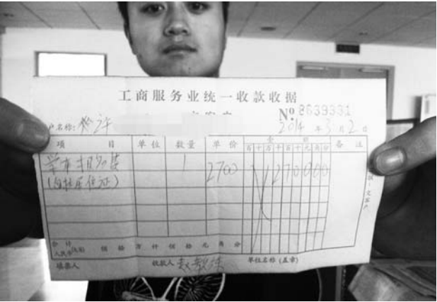
有这份署名赵教练的收据作为学车缴费的依据。

记者咨询律师得知,学员在驾校练车的时候,教练应全程在车内指导,出现事故话由驾校负全责。