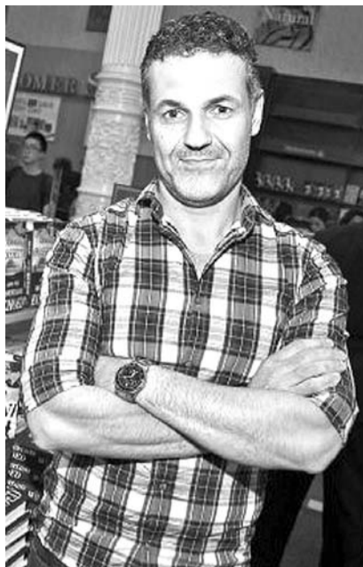
阿富汗裔作家胡赛尼