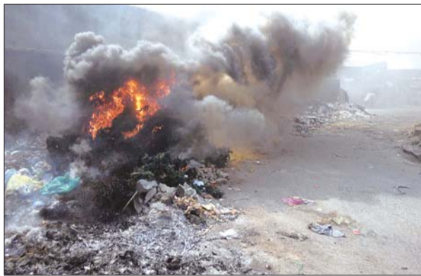
13日下午,这个马路垃圾场又被点燃,黑烟滚滚。

记者从华山街道办事处城管科了解到,此处垃圾清理工作应该由宋刘庄负责。记者来到宋刘村村委,工作人员表示不能代表村委说话,而记者多次拨打工作人员提供的村支书手机号,未能接通。