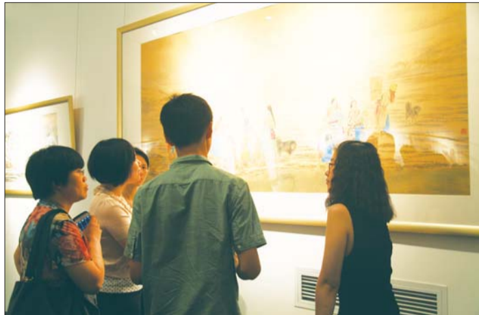
▲工作人员为藏家讲解作品

今日,“墨染天际——西部风情六人展暨齐鲁美术馆开馆展”落下帷幕。十天来,上千位艺术爱好者与艺术机构经营者来到新建成的齐鲁美术馆,一睹名家笔下的高原圣地风情。