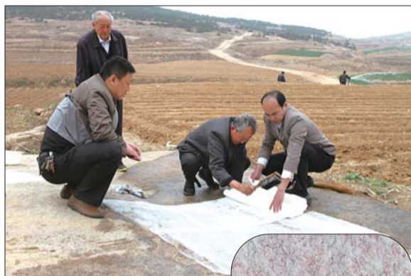
▲考古人员正对现场进行推拓。

据分析,该岩画应为一处祭祀太阳的祭台,与莒县在陵阳河遗址发现的陶文有一定联系,内容均为太阳崇拜。“我分