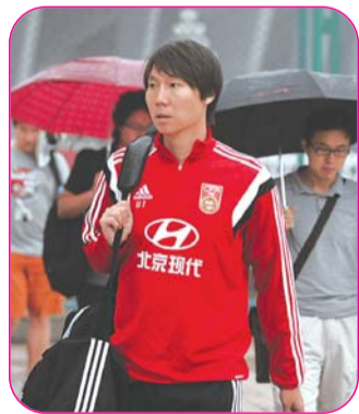
李铁冒雨赶往训练场。

6月22日下午,济南电视台娱乐频道将直播中国队同马其顿队这场赛事,老师殷铁生担任解说。