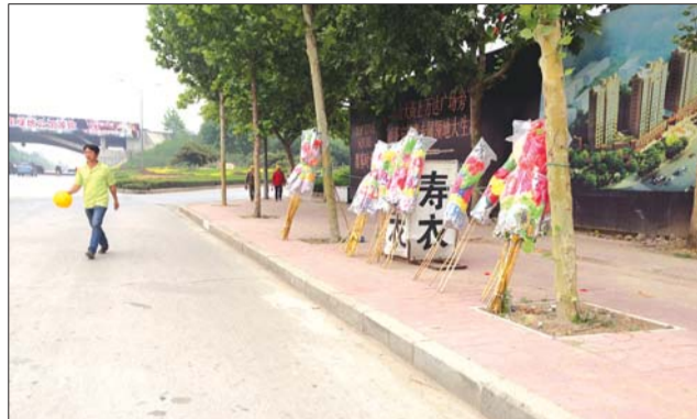
泰山大街中段路北侧,花圈绑在树上卖。本报记者 赵兴起 摄

在泰城停留的几天中,邹先生在城里转转发现,从泰山大街、东岳大街这样的主干道,到文化路、青年路等普通市区道路,再到胡同街巷,支一个衣架、铺一块床单、摆一张小桌,都能形成一个摊位。