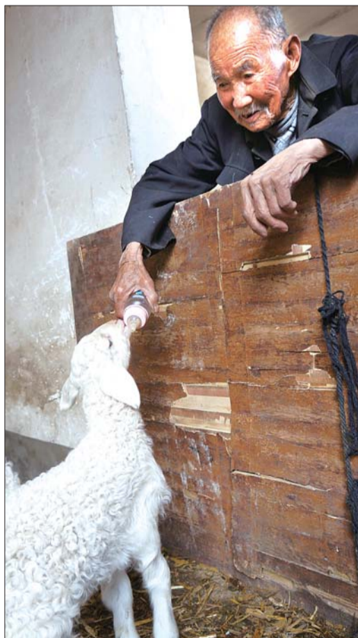
老人养了一群羊,给刚出生不久的小羊喂奶是他最乐意干的事。