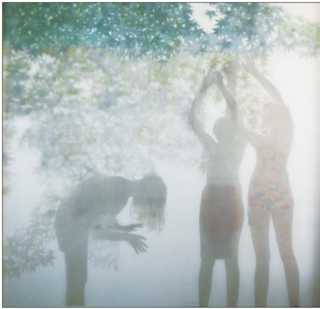
▲《微光》 175x180cm 于磊

(本报讯) 仇东、张家祥书画展于6月17日在济南大明湖超然楼名士阁举行,展期一个月。仇东现为中国书协联谊会理事、中国书协会员、山东省书协副秘书长、泰安市书协主席,笔墨精湛,敷色独特。张家祥现为中国书协会员、济南军区书法创作委员会主任、山东省书协副秘书长兼创作委员会副主任、济南市书协副主席,以章草婉转流动、笔势奔放的书法在山东书坛形成了一道风景。