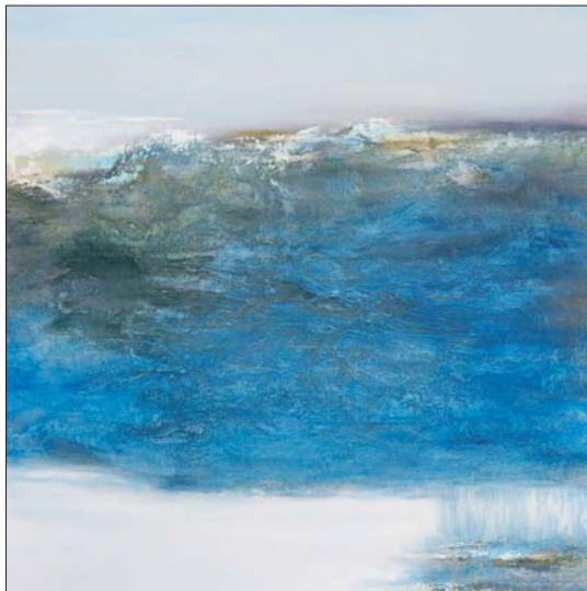
▲山冈在它对远天的希冀中,愿像云朵一样带着它无尽的热切探求