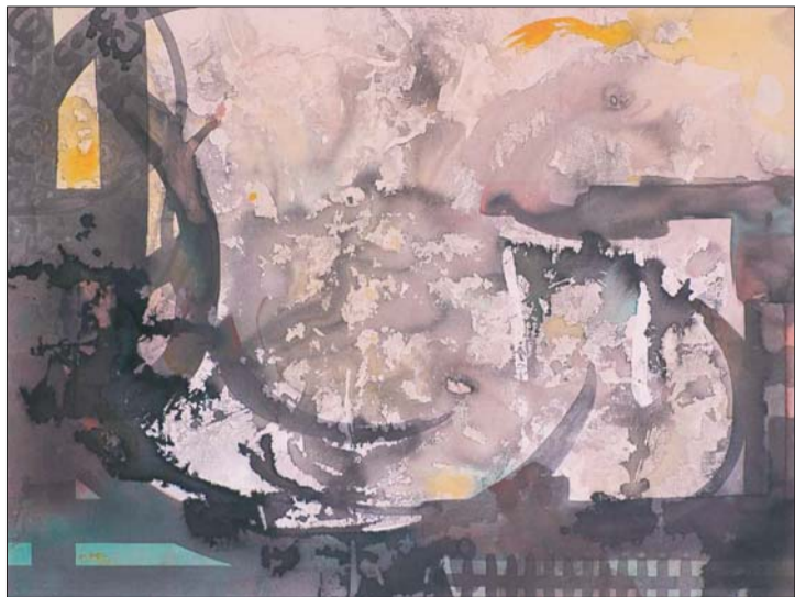
▲群星环绕着初天的夜晚 无声地敬畏她永难触摸的孤寂·天龙座