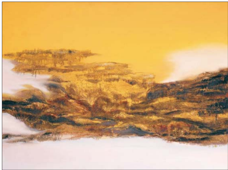
▲这山不就像一朵花吗?峰峦便是花瓣,正畅饮这阳光