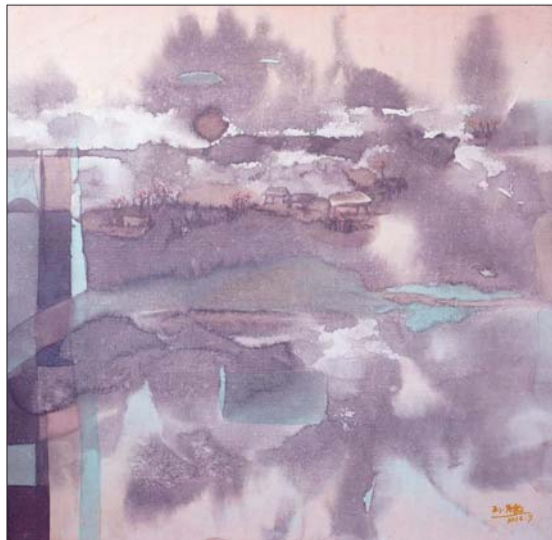
▲群星环绕着初天的夜晚 无声地敬畏她永难触摸的孤寂·小熊座

刻字作品《女人·花·梦》荣获第二届“杏花村汾酒集团杯”全国书法电视大奖赛金奖。入展第九届、第十一届、第十二届国际刻字展;全国第六届、第七届、第八届、第九届现代刻字艺术展评委。