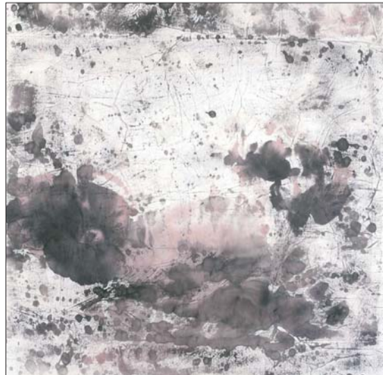
▲群星环绕着初天的夜晚 无声地敬畏她永难触摸的孤寂·猎户座