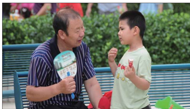
22日,凉爽空气撤走,气温又开始走高。

在19至20日大暴雨之后,21日整体空气质量较好,空气质量等级为良,22日空气质量稍下降,成为轻度污染。气象专家解释说,一般而言,污染物得以扩散的主要天气条件是降水和风力。降雨后大气“洗了个澡”,空气质量得到改善,但天气转晴后,由于相对湿度较大,风力较小,不利于新产生的污染物扩散,便又成了轻度污染。