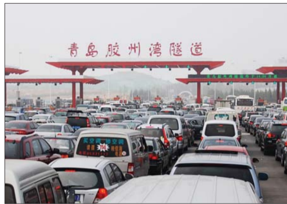
青岛胶州湾隧道开通后极大方便了西海岸与青岛主城区的交通。(资料片)

随着户籍制度改革的推进,将有更多的农业人口实现城镇化,给房地产业的发展将带来大量的潜在客户。