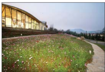
小镇售楼处 总值力争达到5000亿元,接近当前全青岛的经济总量。

2014年06月09日,中国政府网公布《国务院关于同意设立青岛西海岸新区的批复》。国务院同意设立青岛西海岸新区,青岛西海岸新区,包括青岛市黄岛区全部行政区域,国务院明确以海洋经济为主题,是中国第9个国家级新区。对于青岛而言,西海岸肩负着“三个再造”的历史使命,即再造一个青岛港、再造一个青岛主城区、再造一个青岛经济总量。预计到2020年,青岛西海岸新区将构建起海洋科技创新引领海洋经济可持续发展的格局,生产