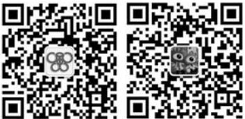
扫描二维码查看活动详情