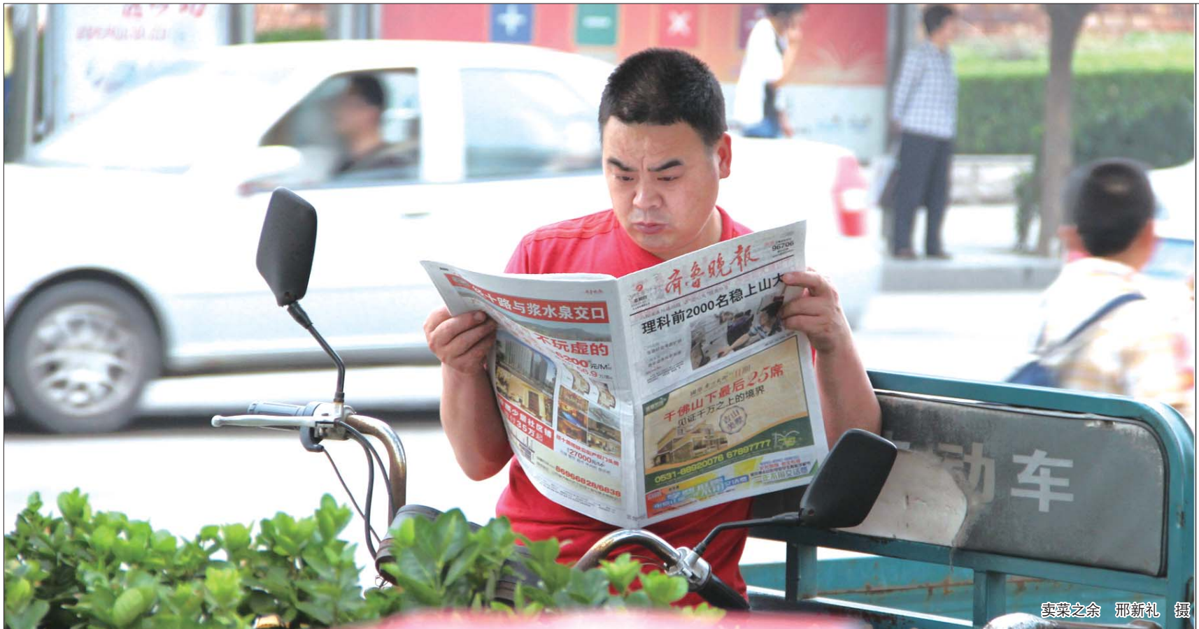
卖菜之余