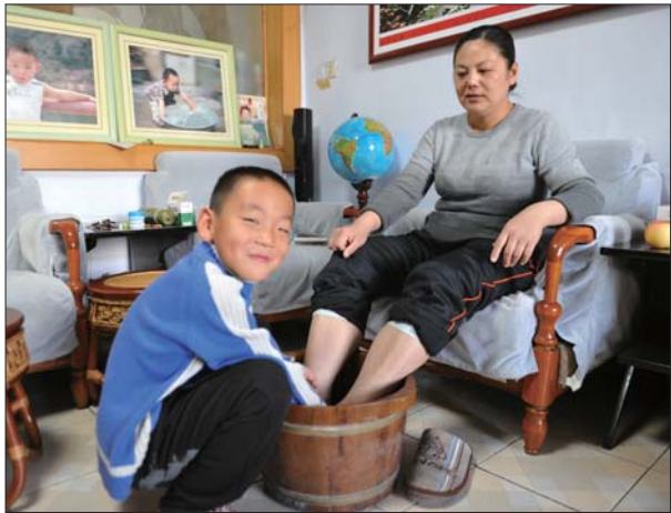
妈妈,我给您洗洗脚