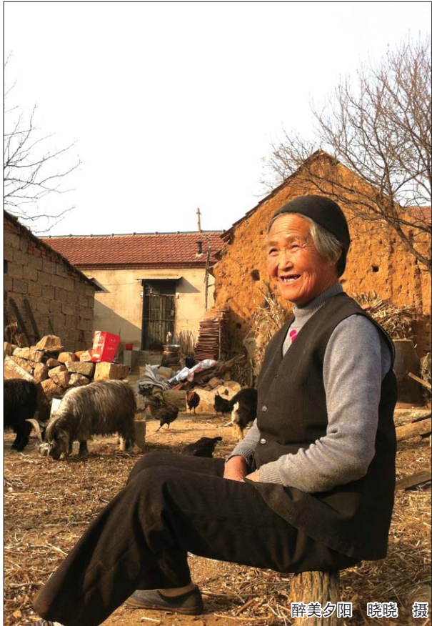
醉美夕阳