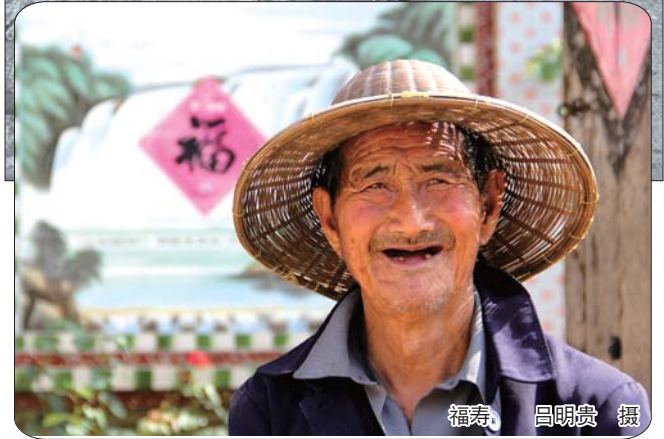
福寿 吕明贵 摄