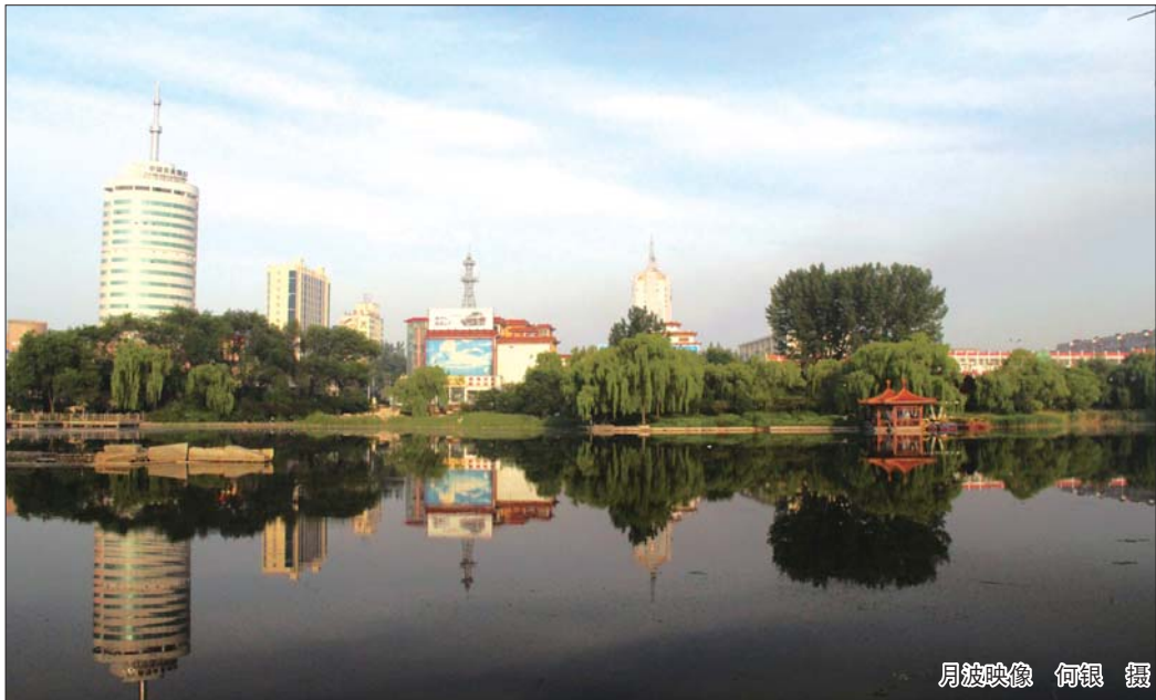
月波映像 何银 摄