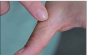
▲由于吸毒,菲菲身上留下了不少伤疤。

菲菲(化名)说,她需要的不是同情,而是理解。”还有三个月,她便可走出强制戒毒所,如今她最担心、最忧虑的就是面对熟人,她无法承受那些陌生亲戚歧视的眼光。像菲菲这样的吸毒者大都心灵单纯,对于生活她们有自己的向往。而对于新生活,她们所期望的是信任与理解,而不是排斥与歧视。 18岁那年,她被警察抓到,此时,她已经感受到毒品对自己的影响,暴躁易怒,神经脆弱,胃病缠身,于是她决定自戒。可没过多久,她再次陷入泥沼。 20岁时,菲菲被送入山东省女子强制隔离戒毒所。规律的作息,可以学到一技之长,还有戒毒所警察的细心照顾,菲菲用了几个月,便从生理上戒除了冰毒。然而最难熬的是,对于毒品的心理依赖。“只要不吸毒,脑子里整天都想着怎么找冰毒。烦躁、焦虑,感觉只有吸毒才能让自己恢复平静。”如今只要菲菲的情绪产生波动,警察便会带她做音乐治疗。 菲菲出生在新疆,菲菲的父母在乌鲁木齐打拼多