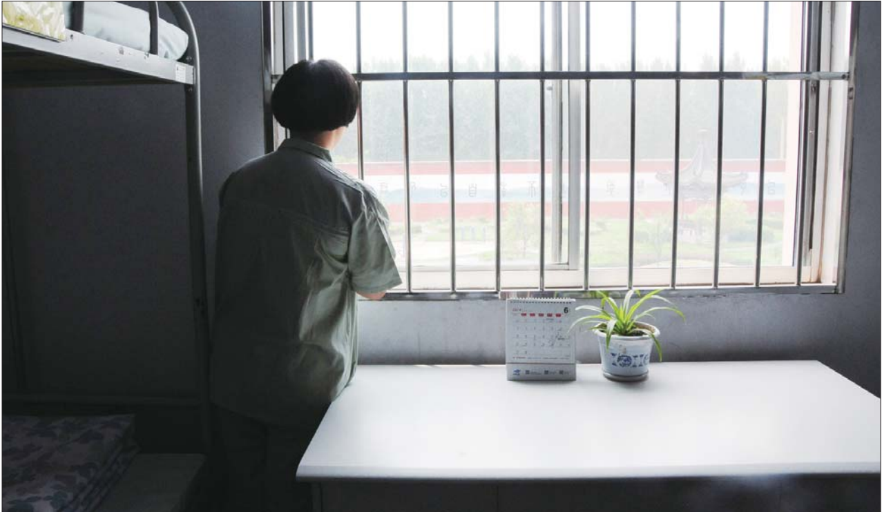
▲还有三个月菲菲要离开这里了,她对外边的世界有向往也有担忧。

案件已呈现出大宗化、武装化趋势,贩毒手段也在向网络销售及物流发送等新型手段转变。“以前抓获的贩毒案件,毒品往往只有几十克。最近破获的案件中,毒品都达到了5公斤左右。而犯罪份子也往往配备武器,拥有很高危险性。”徐桂玉介绍说,公安机关对于涉毒犯罪案件采取“零容忍”态度,有毒必肃,贩毒必惩。