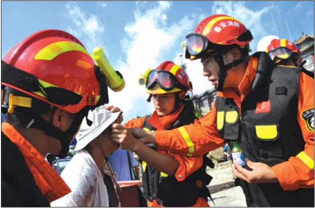
消防官兵对摔伤游客进行救助

2010年6月30日,国务院、中央军委授予泰山消防中队“泰山卫士”荣誉称号。 四年前,党和人民给予了泰山中队全国公安消防部队的最高荣誉。 四年来,这支消防铁军始终传承“誓言如山,尽责至善”的泰山消防精神,以自己的青春和热血守卫着泰山的和谐平安,为打造平安泰山、营造旅游文明窗口、促进社会和谐作出了新的贡献。