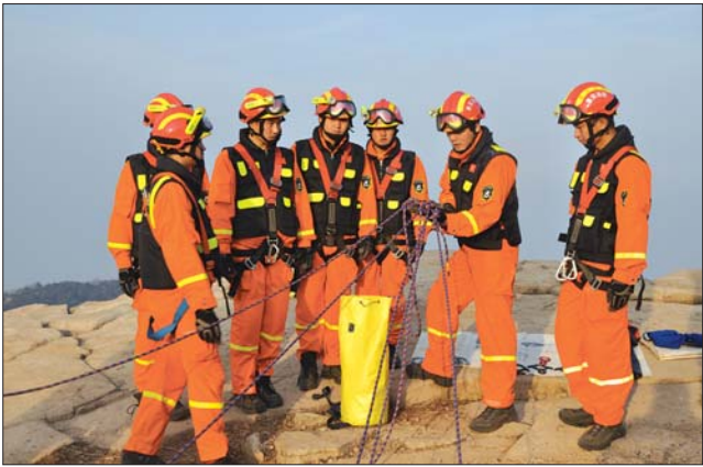
泰山中队官兵改良创新“章鱼”系统山岳救助操法