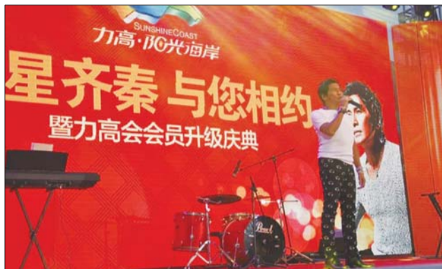
齐秦献唱力高·阳光海岸会员升级庆典