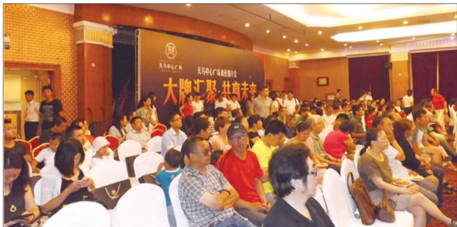
天马中心广场商业推介会现场

6月28日,天马中心广场于开发区新时代大酒店举行商业推介会,标志着天马中心广场商业正式启动。