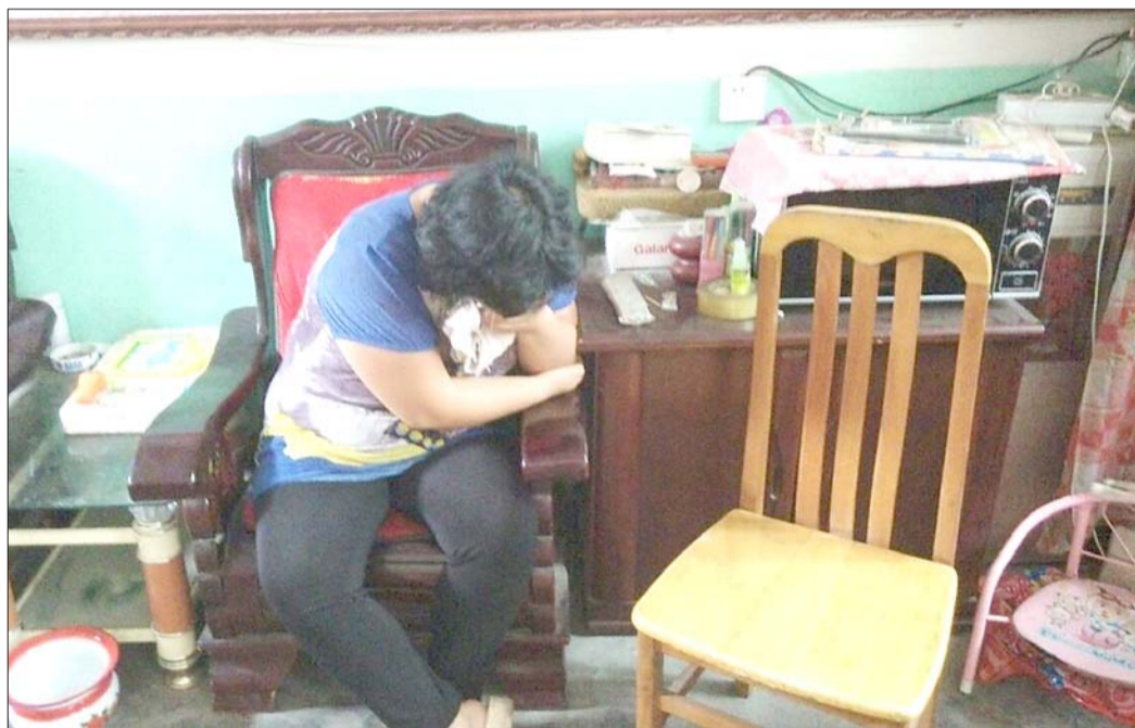
丈夫突然身亡,丁先生的妻子痛不欲生。

26日早上六点半左右,滕州市姜屯镇大朱楼村的丁先生还在睡梦中,相隔不远的邻居大嫂50多岁的生女士就来找他帮忙,说自家的电视坏了希望丁先生去帮忙修理。但是没想到,早上七点半左右,生女士突然匆匆忙忙跑到了丁先生家,告诉丁先生的父亲丁先生喝了农药。最终,丁先生没有被抢救过来,现在死因不明,家人已经申请尸检。