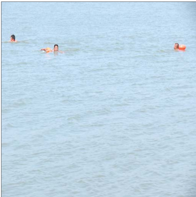
在园博园长清湖游泳的人如今越来越少。