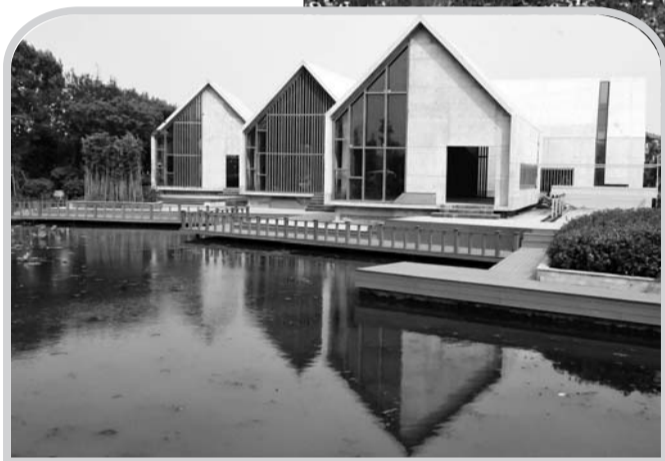
◀独具特色的餐厅即将投入使用。