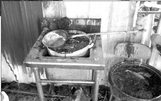
▶做好的油泼辣酱粉还摆放在店内。