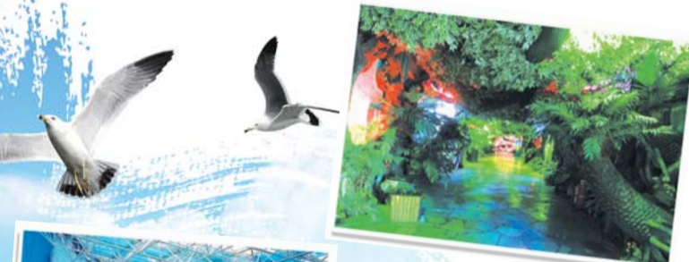
蓬莱海洋极地世界