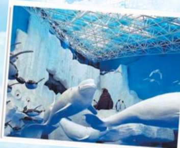
蓬莱海洋极地世界