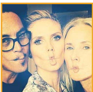
当地时间2014年3月2日, 美国洛杉矶, 第86届奥斯卡金像奖。爱尔兰—鲍德温在Instagram上上传图片晒近况, 与好友搞鬼自拍。

荧幕前的女神、男神们在社交网络上个个秒变男、女神, 各种搞怪自拍比丑不手软, 从小儿科的嘟嘴瞪眼标准鬼脸, 到豪露腋毛, 明星们更用各种高科技APP搞鬼, 麦莉·塞勒斯(Miley Cyrus)把自己的眼镜P成无底洞。大明星们, 请不要放弃治疗!