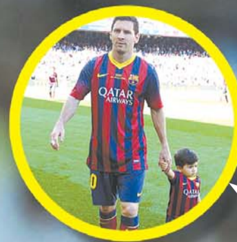
西班牙巴塞罗那, 2013/2014赛季西甲第36轮, 巴塞罗那2:2赫塔菲。梅西带着儿子提亚戈现身诺坎普球场。