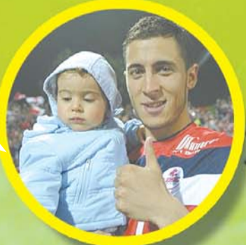
2011/2012赛季西甲第38轮, 里尔VS南锡, 阿扎尔和儿子现身球场。