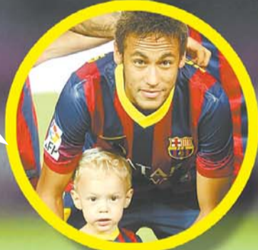
西班牙巴塞罗那, 2013/2014赛季西甲第6轮, 巴塞罗那4:1皇家社会, 内马尔和儿子卢卡现身球场。