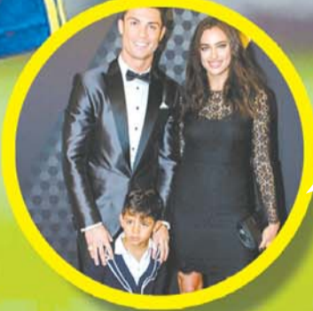
瑞士, 2013年国际足联金球奖颁奖典礼, C罗和女友、儿子亮相。