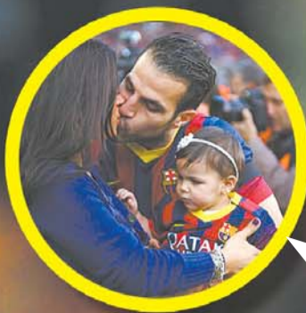
西班牙巴塞罗那, 2013/2014赛季西甲第18轮, 巴塞罗那4:0埃尔切。小法一家甜蜜地拥抱着在一起。