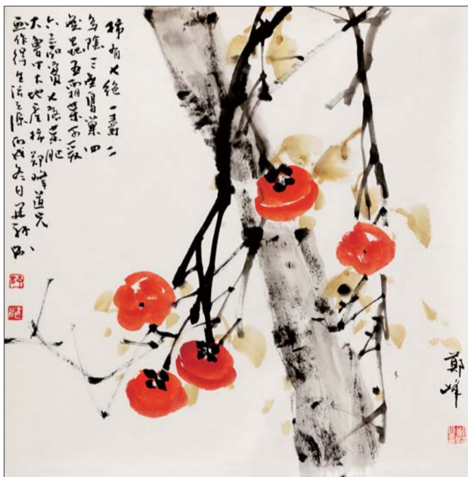
▲国画斗方《事事如意》 68cmX68cm

(作者/孔维克,山东省文联副主席,省美协常务副主席,山东画院院长,全国政协委员,中国美协理事)