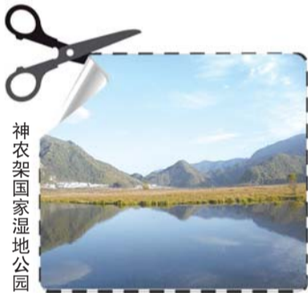
神农架国家湿地公园

神农架位于湖北省西部边陲,是我国唯一以“林区”命名的行政区。这里拥有当今世界北半球中纬度内陆地区唯一保存完好的亚热带森林生态系统,境内森林覆盖率达88%,保护区内达96%,成为世界同纬度地区的一块绿色宝地。当南方城市夏季普遍高温时,神农架却是一片清凉世界。