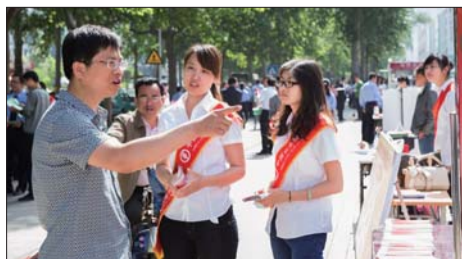
银行职员进行政策宣传。

活动中,在网点及城市繁华地段设立咨询点集中宣传,设立宣传展板,发放小微企业金融服务宣传手册,加深了社会公众对农业银行服务小微企业的认知程度。同时,客户经理还深入社区、商户、企业,面对面宣传金融产品,征求客户对该行的服务需求和意见建议,提高宣传小微企业金融