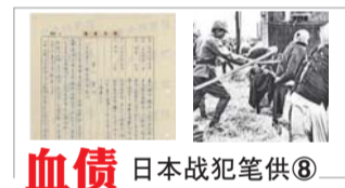
血债 日本战犯笔供⑧