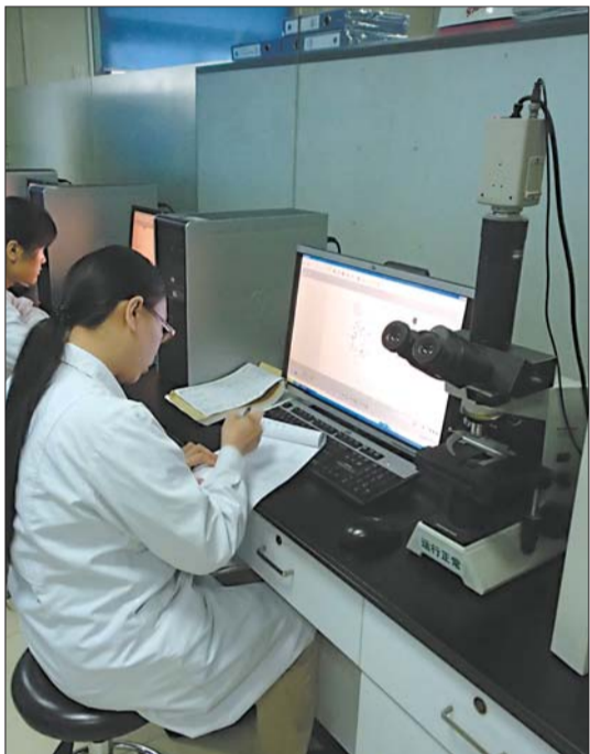
在市妇幼保健院产前筛查和诊断中心实验室,工作人员正对各种样本进行检测。