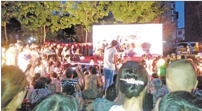
7月3日晚7点,鑫苑物业济南国际城市花园为社区居民送上了一场丰盛的文化消夏晚会。

此届高新区消夏晚会社区巡演将持续到8月底,本报也将及时对活动进行报道,社区居民可以关注晚会的演出时间和地点,我们也诚邀合作商家与高新区社区居民一起,共享文化消夏盛宴,详询15866647798。