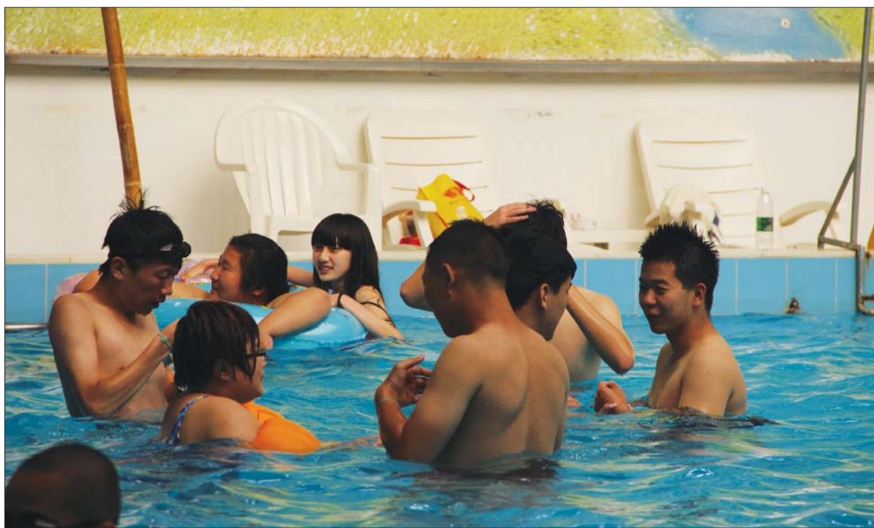
▲一群年轻人在泳池内进行短暂休息。

游泳是人们在夏天最喜爱的一项运动,随着近年来人们对游泳安全认识的提高,选择去游泳场馆成为越来越多市民的选择。游泳池里出现了人满为患的现象,记者调查发现游泳馆内的水多采取24小时循环过滤和消毒剂杀菌的方式,但是彻底换水的周期不确定,每个游泳馆都会配备几名救生员保障游泳者安全。