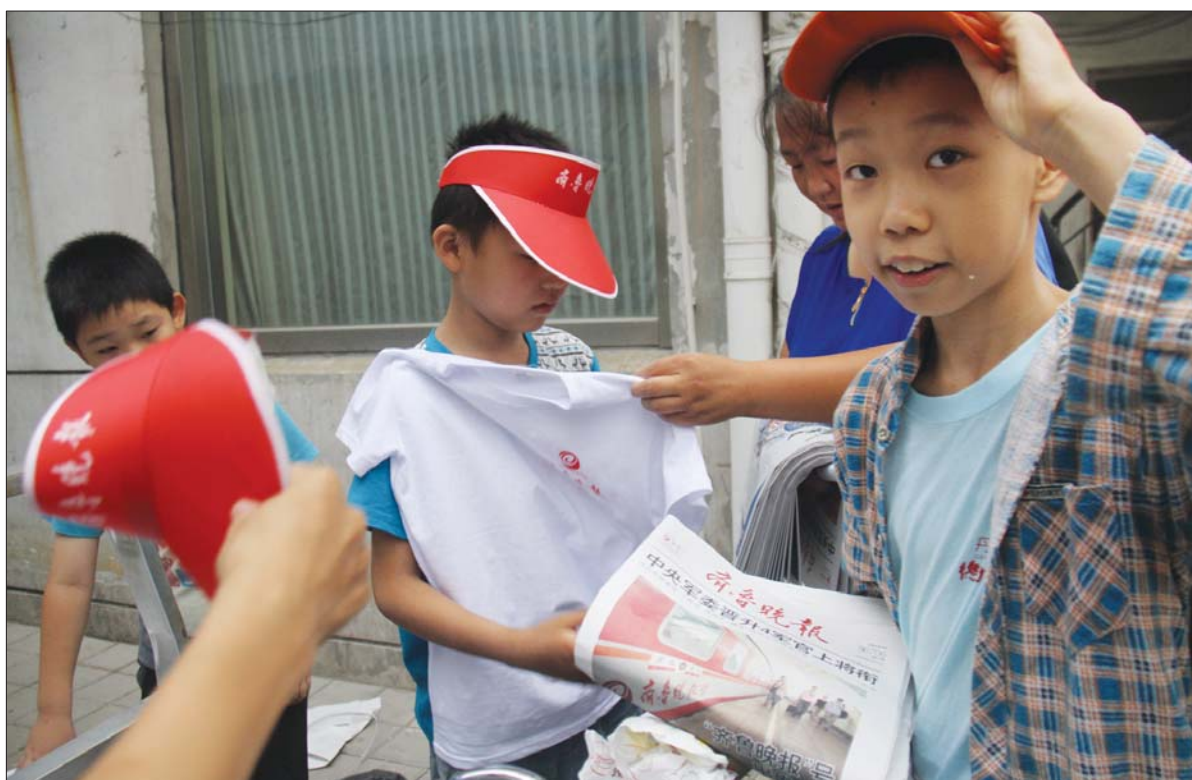
12日早上6点,小报童领到首批免费报纸和T恤。

本报7月13日讯(记者 孙婷婷) 12日,本报“开建·紫麟苑”杯暑期小报童活动正式启动,200余名小报童领到免费赠送的20份报纸后,走上挑战自己的卖报征程。活动首日,不少家长主动提出不要刊登排行榜的要求,只希望孩子得到锻炼,而不是参加比赛。同时,活动期间,本报继续接受报名,还未报名的小报童,可要抓紧时间了。