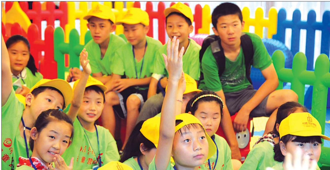
昨天下午,本报报童营销秀再度启动,今年的主题是“卖一份好报,读一本好书,做一件好事”。从今天开始,泰城、新泰和肥城的数百名小报童将走上街头,体验营销收获成长。他们走过您身边时,即便不能买一份报,希望您也能给他们一个鼓励的微笑。图为培训现场报童踊跃发言。