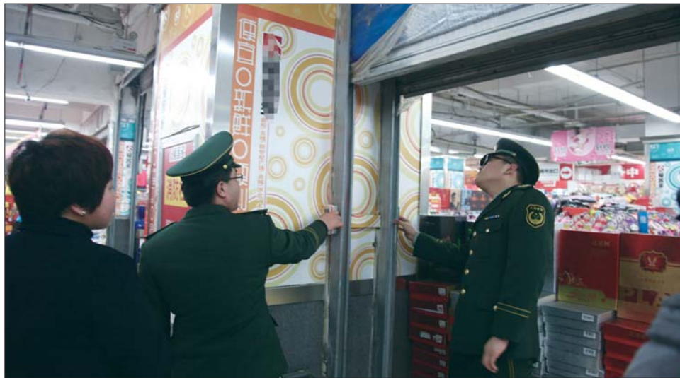
消防人员检查该大厦地下超市的防火分区。(资料图)

本报济宁7月15日讯(记者 路帅 通讯员 杜波涛) 2014年2月12日, 山东置城集团有限公司汇景国际城因涉及存在重大火灾隐患问题, 被山东省政府挂牌督办。经济宁高新区管委会和消防部门多次现场督导, 截至目前汇景国际城火患整改已完工大半, 预计年底可完工。