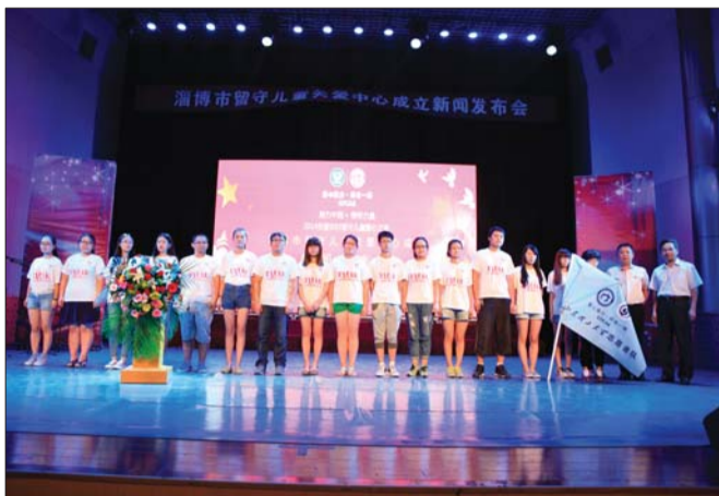
山东理工大学举行志愿者团队授旗仪式。

山东理工大学外国语学院团总支老师曹晓媛发出倡议,希望青年学子积极加入到“关爱留守儿童”志愿服务接力计划中来,尽己所能为留守儿童描绘一个多彩的童年。