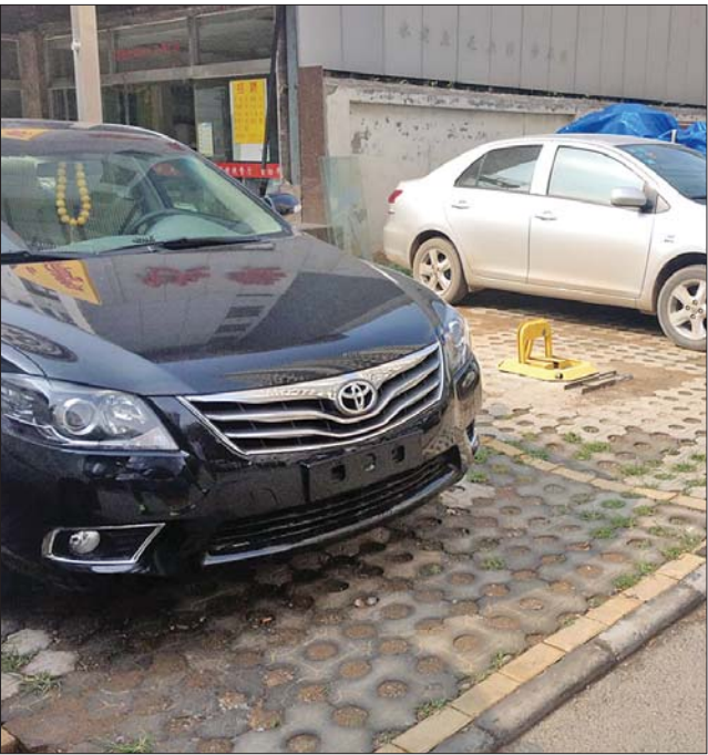
因车位锁被撬走,王先生的车位被一辆黑色轿车占用了。

城管为何要撬走王先生的车位锁呢?15日,记者联系了高新区城管局的相关负责人,该负责人表示,“车位问题不属于城管局的管辖范围,整治社区里面的各种不良现象属于居委会管辖,尤其是前段时间创卫,居委会带领大家整治小区里面的乱搭乱放等,这件事应该找鑫苑国际居委会。”小区居委会也表示,对王先生车位锁一事不知情。 据了解,目前王先生已经准备好车位租赁协议以及物业证明,他想让城管部门给个说法,“第一,要求城管部门给我换锁,赔偿损失;第二,我退一步,不要求赔偿,我自己换锁,但要同意我一直租用车位并上锁,不能无缘无故撬我车位锁。”王先生说。