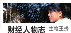
财经人物志 主笔王贇

国家主席习近平和巴西总统罗塞夫笑意盈盈地望着百度董事长兼CEO李彦宏——这是7月17日,中巴元首一起见证李彦宏启动百度搜索葡语版上线定格的一个镜头。