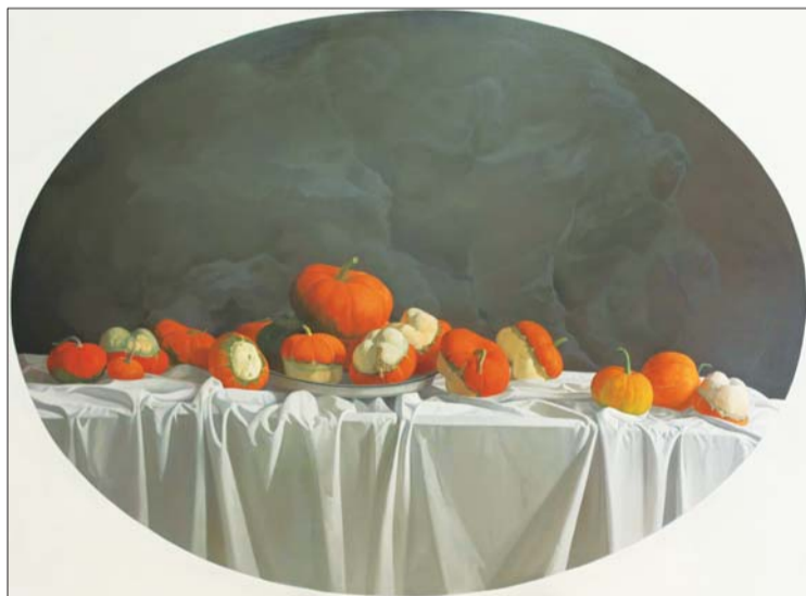
故园秋韵 180x135cm 李雪松

传统教学观念的影响和创作环境的限制，令学院老师的油画处于一个特别的区间，他们不像很多职业艺术家一味追求艺术观念的表达，作品十分前卫；也不像很多学院中遵循传统、墨守陈规的教师那样思想僵化且一切以传统为导向为审美。他们的油画是在遵循传统的基础上进行突破和创新。此次参展的画家，有的是将戏剧人物作品视为用西方油画技法来表现中国传统文化的艺术元素，如岳海涛；有的是把东方人眼中的油画风景用西方的油画艺术来表现，如孙营、邹光平、冯晋等；有的画家是探索油画艺术中的观念表达，如朱红梅、焦伟、李雪松等。这些画家有着深厚的绘画功底，通过油彩在笔下的不停转换和涂抹，来寻找自己的笔墨语言。