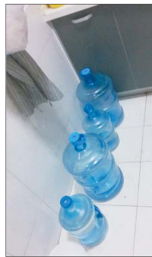
住在4层的居民家里储存了不少的桶来接水。

记者还了解到,为了彻底解决东部城区缺少水源的现状,相关部门还准备利用远道而来的长江水建设水厂,设计每天可供水20万方,“随着这两座水厂的完工,东部城区的供水难题有望暂时缓解。”相关部门也正在考虑在东部地区选址新建一座引黄调蓄水库,调蓄能力为每日40万-50万立方米,确保东部城区供水得到保障。