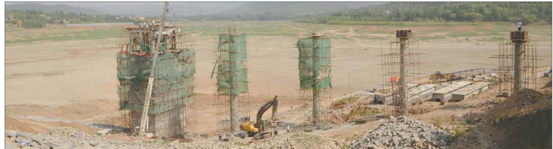
狼猫山水库正在除险加固进行维修,已经暂停供水。