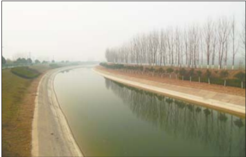
输送长江水的济平干渠,长江水也有望成为省城东部城区饮用水源。