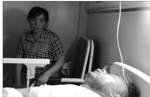
伤者躺在床上,脸上涂了烫伤药。