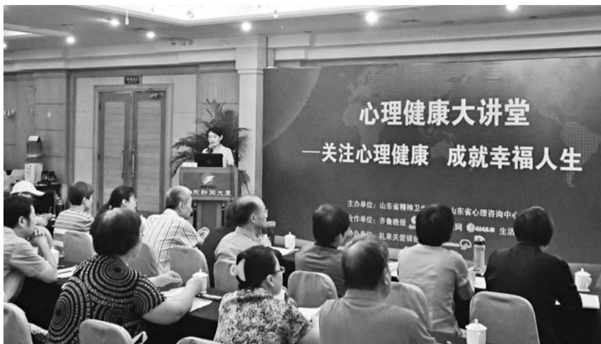
26日,第二期健康大讲堂活动现场座无虚席。

大量的追踪研究发现,安全依恋的儿童在学前期往往被教师评定为具有高度的自尊、交往能力强、善于合作、受