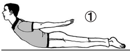
①俯卧床上,去枕;双手背后,用力挺胸抬头,使头胸离开床面;同时膝关节伸直,两大腿用力向后也离开床面;持续3~5秒,然后肌肉放松休息。3~5秒为一个周期。

伸”(图②)两个动作。锻炼时也不要突然用力过猛,以防因锻炼腰肌而扭了腰。如锻炼后次日感到腰部酸痛、不适、发僵等,应适当地减少锻炼的强度和频度,或停止锻炼,以免加重症状。