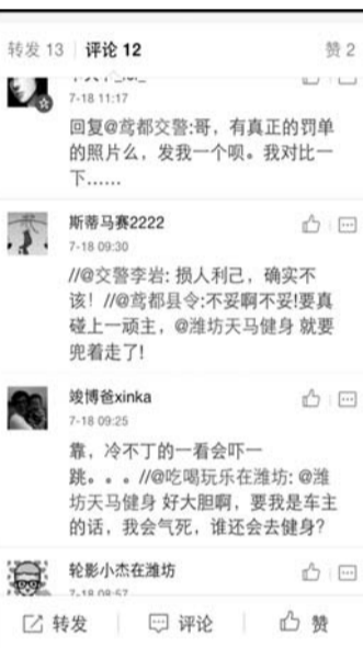
◀宣传单引发网友热议。