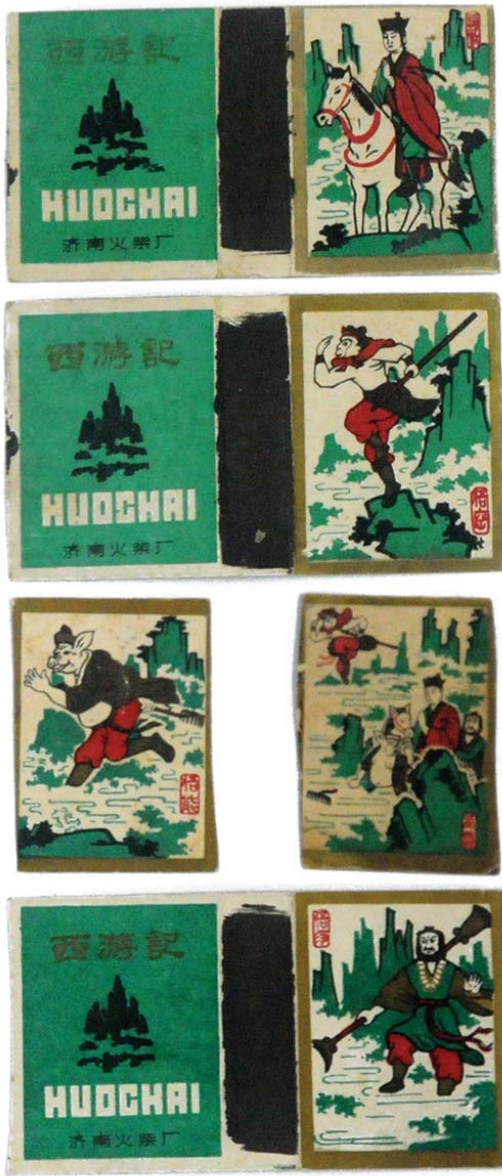
西游记全套火花盒。